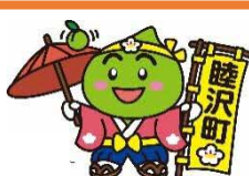
睦沢町 うめ丸くん