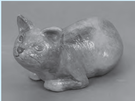
青猫 小原由紀子作