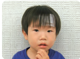
ふきの あさひ くん これからも歯みがき がんばろうね。