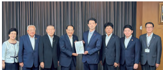
(会長) いすみ市太田市市長 (左から4人目)、熊谷知事 (5人目)

外房地域が一丸をなり「長生グリーンライン」の全線開通に向けた事業の加速化、また「鴨川・大原道路」は計画の具体化に向けた調査の実施を要望しました。