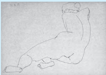
クロッキー 下川吉博作