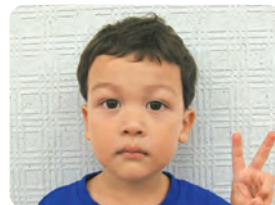
ネシ テオドル たいぞう くん むし歯ゼロよかったね!