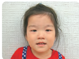
くが はるき くん しっかりみがいてキレ イにしよう